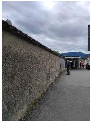
Rätsel Nr. 19 (Seite 12)

Immer noch keine Spur? Dann beantworte doch ganz schnell das nächste Rätsel. Der Mann auf dem Bild löst es wohl auch gerade.