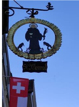
Rätsel Nr. 5 (Seite 9)

Überquere vorsichtig die Strasse auf die andere Seite. Folge dann der Hauptstrasse hinauf und schau genau, wo du den Heiligen St. Meinrad mit den beiden Raben findest.