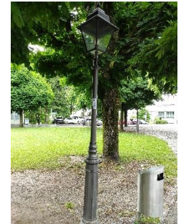
Rätsel Nr. 22 (Seite 13)