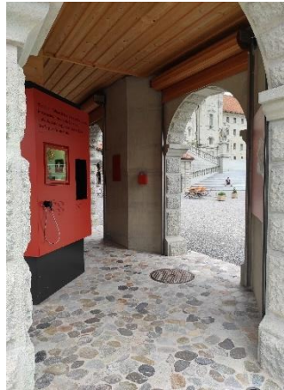
Rätsel Nr. 7 (Seite 9)