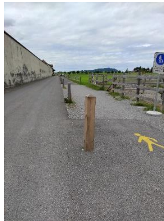
Rätsel Nr. 15 (Seite 12)

Nach dem Rätsel weiter auf der nächsten Seite.