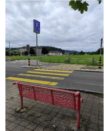
Rätsel Nr. 18 (Seite 12)