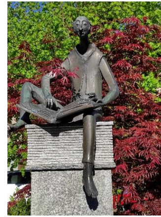
Rätsel Nr.2 und Nr. 3 (Seite 8)

Gehe auf dieser Strassenseite weiter die Hauptstrasse hinauf, bis du diese beiden Raben vom nächsten Bild findest.