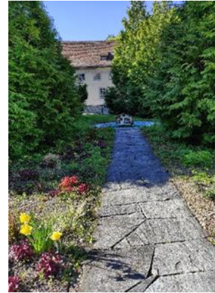
Rätsel Nr. 8 (Seite 10)

Gehe durch das Tor rechts im Innenhof und dann rechts runter bis zur Weggabelung vom Kreuzweg.