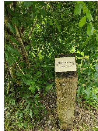
Rätsel Nr. 9 (Seite 10)

Folge dann dem Kreuzweg hinauf dem Bach entlang. Bei der ersten angeschriebenen Pflanze darfst du stehen bleiben und schauen, welches Rätsel auf dich wartet.