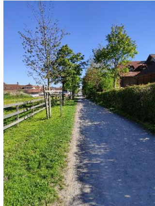
Rätsel Nr. 10 (Seite 11)

Gehe zur nächsten Weggabelung, wo etwas versteckt die nächste Informationstafel steht und löse das Rätsel Nr. 10.