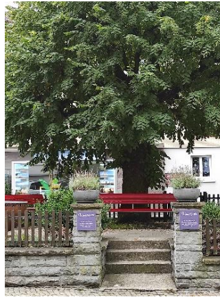
Rätsel Nr.1 (Seite 8)

Gehe aus dem Wunschgarten und drehe dich nach rechts. Du solltest ein paar Schritte weiter einen Brunnen sehen. Gehe zu diesem hin.