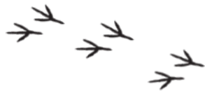
Rätsel Nr. 16 (Seite 12)