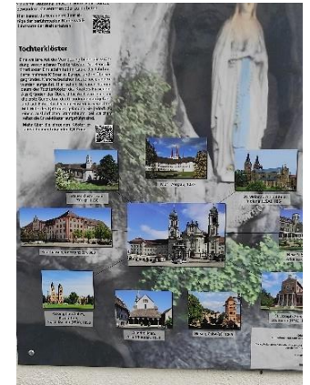
Rätsel Nr. 13 (Seite 11)