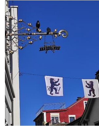
Rätsel Nr.4 (Seite 9)