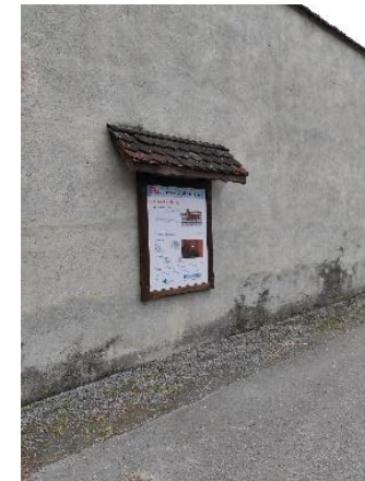
Rätsel Nr. 14 (Seite 11)

Gehe noch ein Stück weiter bis du zur nächsten Tafel mit den braunen Vierbeinern kommst. Da wartet schon dein nächstes Rätsel.