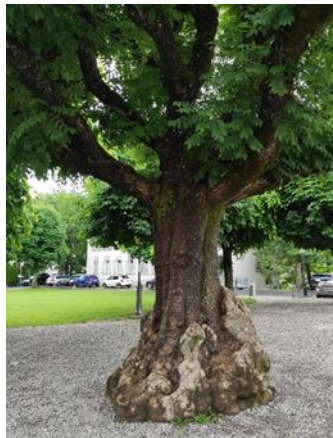
Rätsel Nr. 20 (Seite 12)

Suche jetzt den Brunnen auf dem folgenden Bild. Er ist ganz nah und die Aufgabe leicht.