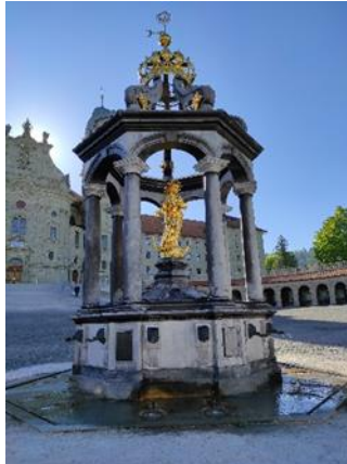
Rätsel Nr. 6 (Seite 9)

Gehe weiter bis du das Kloster vor dir siehst. Schau gut nach links und rechts und wenn kein Auto kommt überquere vorsichtig die Strasse, damit du zum Marienbrunnen gelangst.