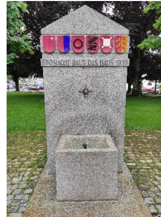
Rätsel Nr. 21 (Seite 13)

Ich hoffe, deine Spürnase funktioniert noch so gut wie zu Beginn der Reise. Auf dem nächsten Bild siehst du eine Laterne und das nächste Rätsel dazu.