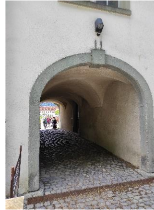
Rätsel Nr. 12 (Seite 11)

Gehe nun zurück durch das Tor wo du hergekommen bist und wende dich dann nach Links. Gehe der Mauer entlang bis du zur folgenden Infotafel kommst.