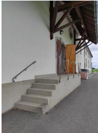
Rätsel Nr. 17 (Seite 12)

Gehe weiter bis du zur Strasse kommst und halte dich dann Links. Du kommst am folgenden Tor vorbei.